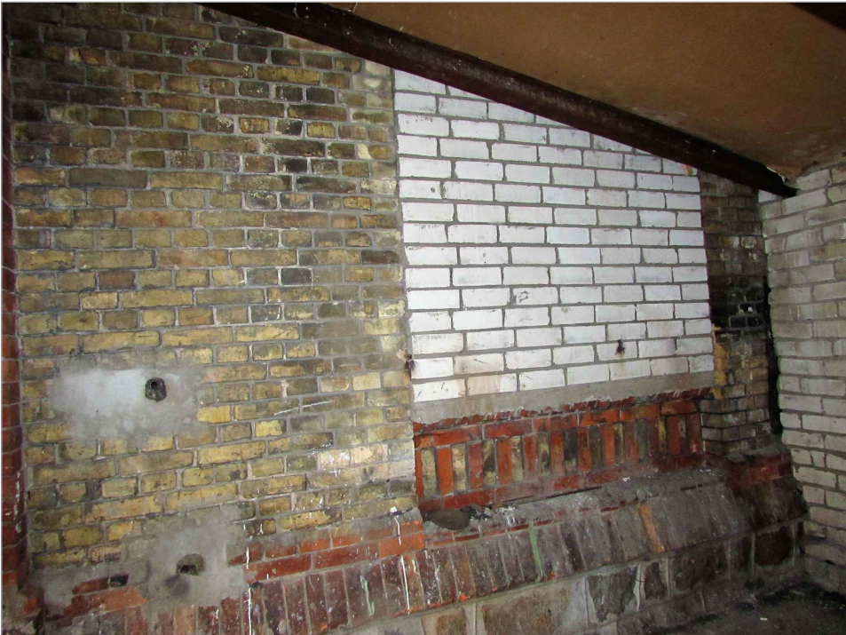
att. 45. Aizmūrētā loga aila piebūvē A.