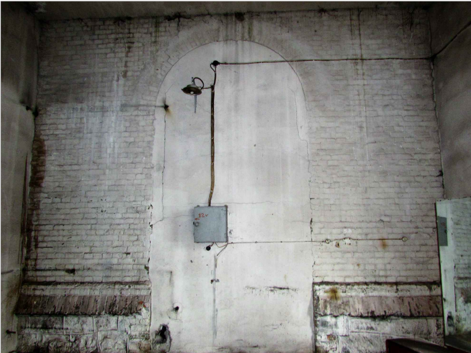
att. 47. Aizmūrētā durvju aila piebūvē B. Siena krāsota ar līmes krāsu.