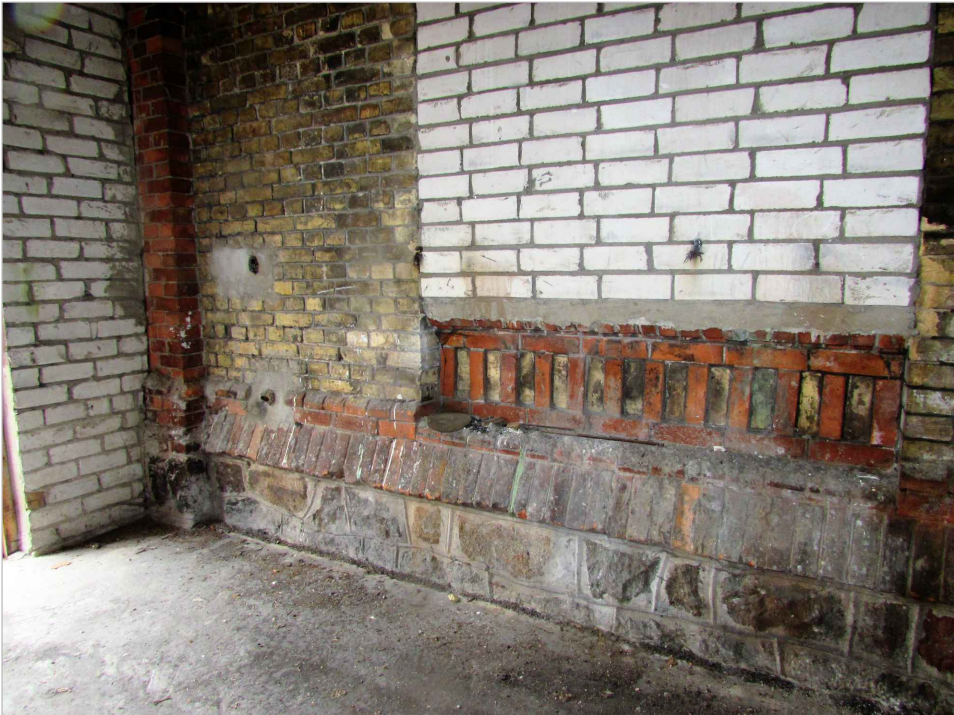
att. 46. Loga aillas dekoratīvā apakšējā daļa.