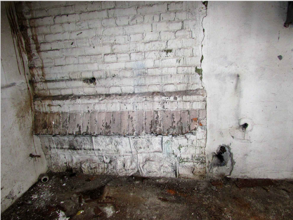
att. 48. Ēkas cokols piebūvē B.